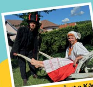
představení Čert a Káča